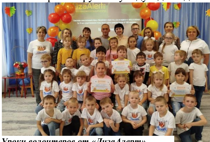
Уроки волонтеров от «ЛизаАлерт»

Педагоги в 2025 году являлись участниками и победителями конкурсов различного уровня: статья «Лучший педагогический опыт»